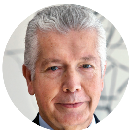
António Saraiva Presidente da CIP

A promoção do talento e o desenvolvimento do capital humano são objetivos de sempre da CIP, porque temos a perfeita noção de que o conhecimento e as competências necessárias para o colocar ao serviço da criação de valor são os principais fatores de competitividade. Acreditamos, também, que é necessário encontrarmos novas abordagens, mais eficazes, para promover a cultura da igualdade de género entre os agentes económicos, porque as empresas não podem desperdiçar talentos.